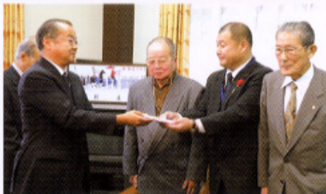
▲新庄まつり委員会に対する寄贈 ▲新庄まつりでの本店前「水出し」